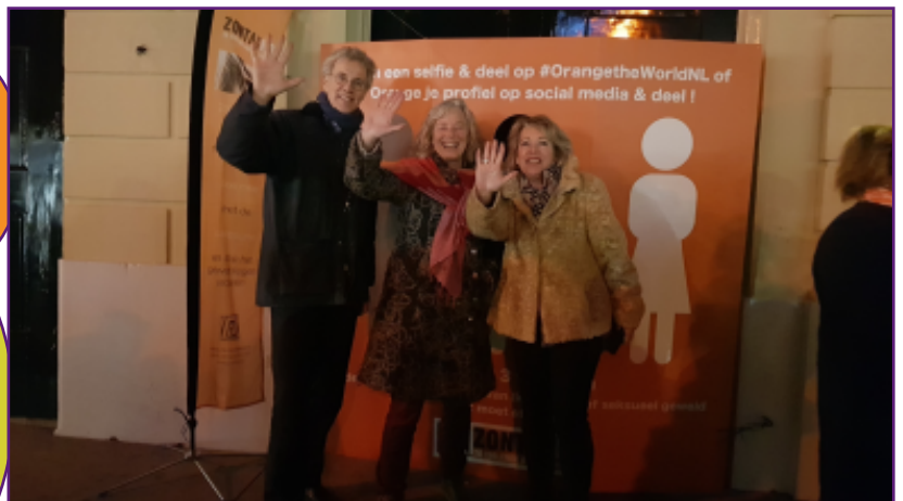
Bestuur Stichting Vrienden van Rosa Manus